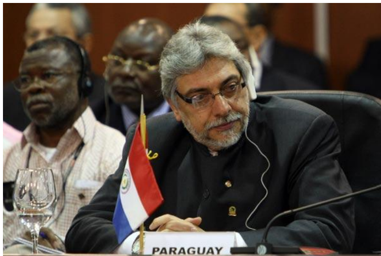
Fernando Lugo Méndez, presidente de Paraguay

Al menos 900 funcionarios paraguayos fueron movilizadas a partir de este lunes y durante cinco meses para elaborar el primer Censo Económico Nacional en 47 años, informó la Dirección General de Estadísticas y Censos (DGEEC).