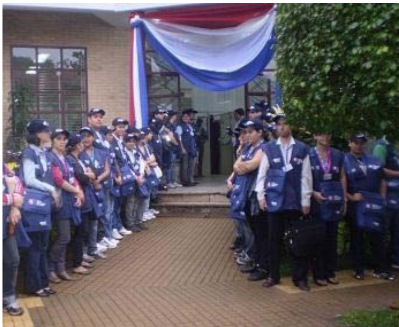
jóvenes que trabajarán en el Censo Económico